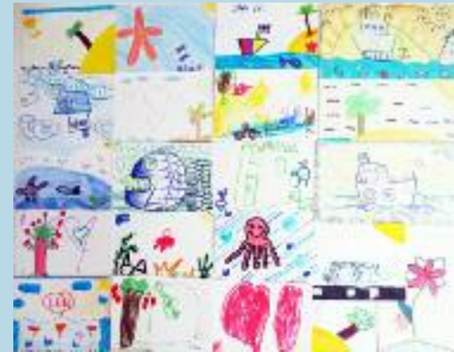
« Avec un ami, tu n'es pas seul. »