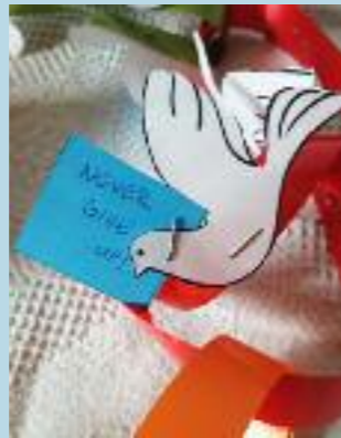
« N'abandonne jamais. »