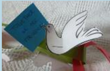
« Ensemble, nous sommes plus forts ! »