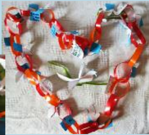
« Tu es digne »