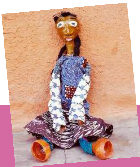
« Ma marionnette s'appelle Biba »