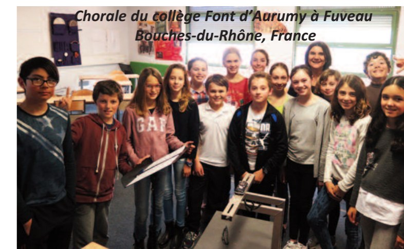
Chorale du collège Font d'Aurumy à Fuveau Bouches-du-Rhône, France

et invente de nouvelles paroles sur la mélodie.