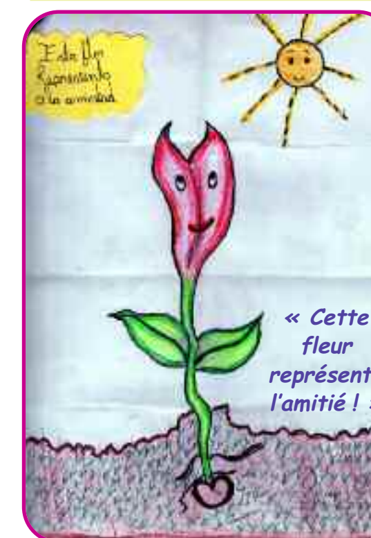
dessin fait par des enfants de Bolivie

« L'arbre avec les fleurs nous aide à fabriquer de l'huile et à embellir le village. »