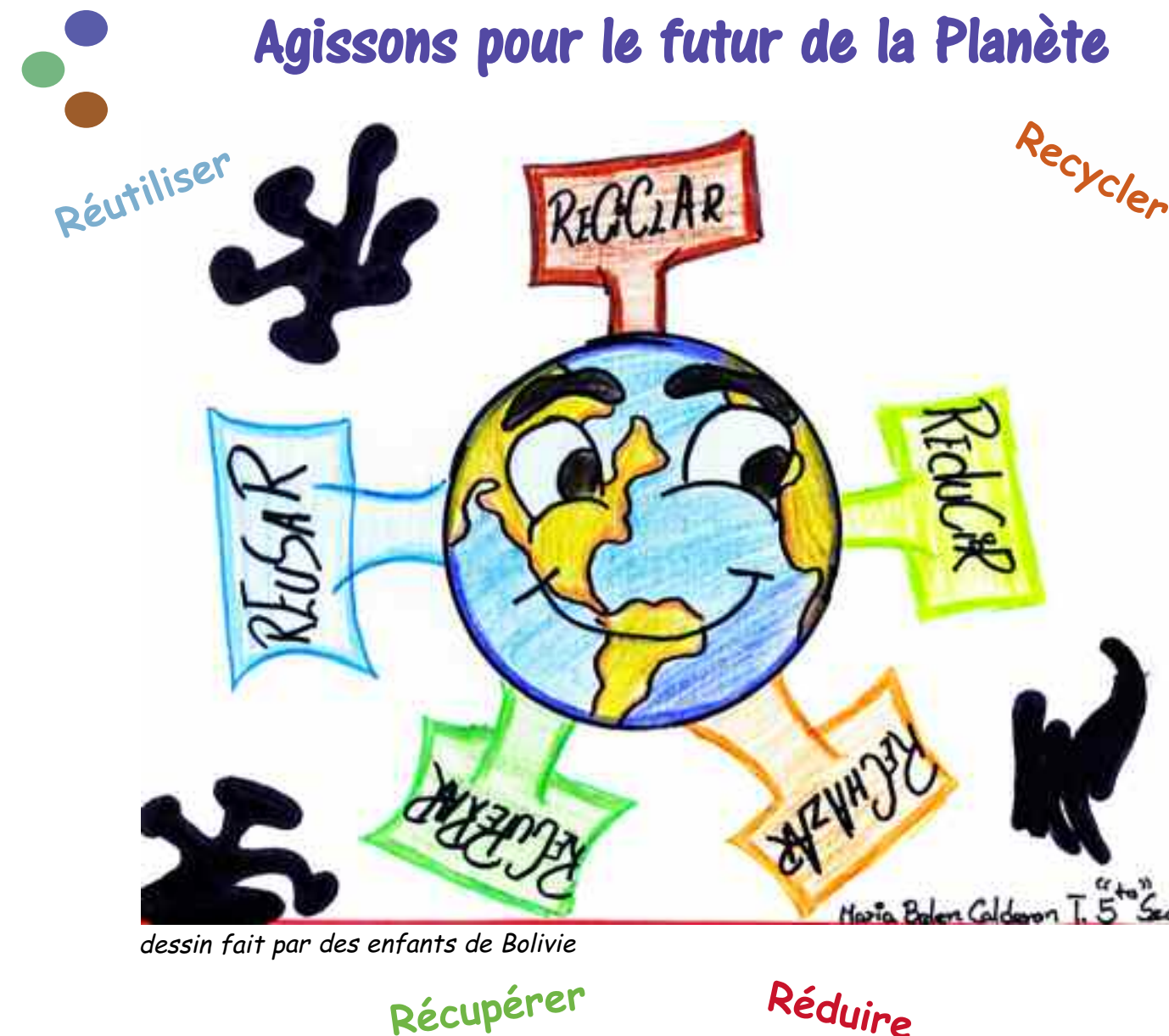
dessin fait par des enfants de Bolivie

Vous nous dites souvent comment vous prenez soin de notre environnement.