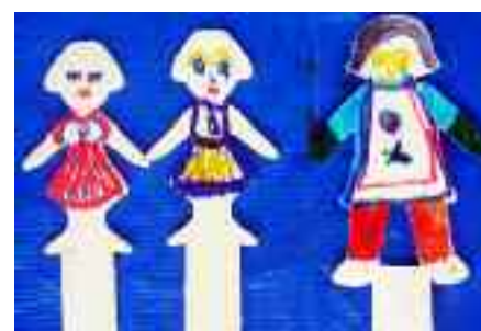
Des marque-pages faits par les enfants des Philippines