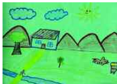
dessin fait par les enfants de Bolivie