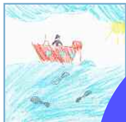
Luka, 8 ans, Croatie