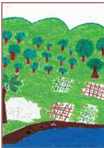
dessin fait par une enfant des Philippines

« Quand on parle sur la paix c'est quand on cultive un champ de maïs. Et pour faire un échange de maïs il nous faut la patience pour attendre la pluie. La paix à besoin de patience et de temps. »