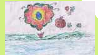
Telah, 10 ans