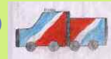
Donne, 10 ans