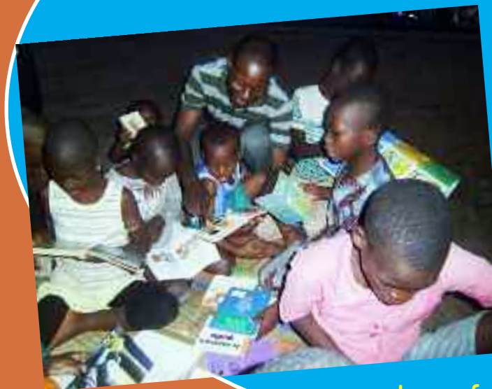
Les enfants CTM de Togo

Bibliothèque de rue et causerie débat au bord de la route, autour de la journée du 17 Octobre et de Tapori.