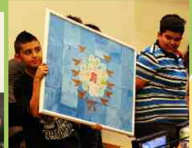
Les enfants présentent le drapeau des Nations Unies fait pendant la Bibliothèque de rue à New York.