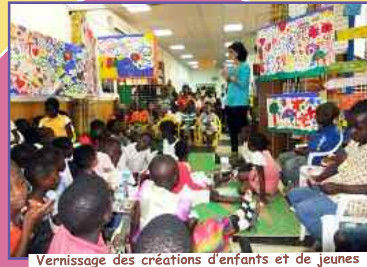
Vernissage des créations d'enfants et de jeunes

Le 17 octobre au Cameroun un clown est venu, pour la plus grande joie de tous les enfants, qui ont dit NON à la misère de toute leur force avec ce clown.