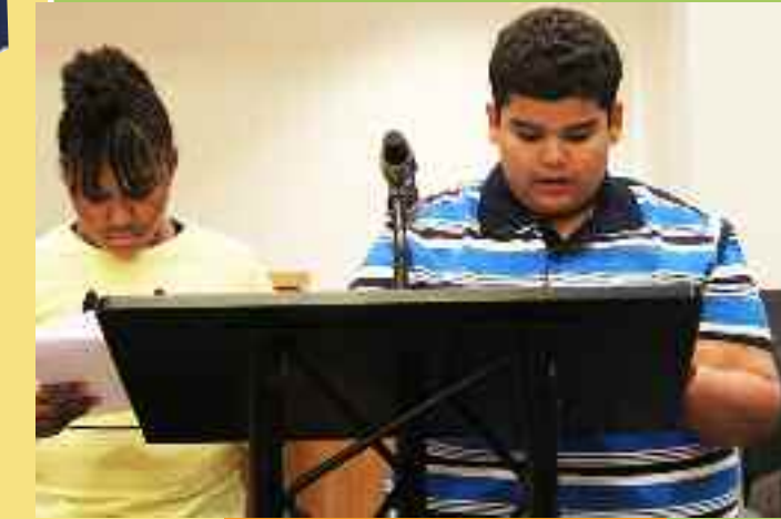
Les enfants lisent leurs témoignages

« Dans nos quartiers et nos écoles le harcèlement et la discrimination arrivent souvent. Nous les enfants, nous pouvons travailler ensemble pour arrêter ce genre de comportement en donnant des exemples de comportements positifs, en ne harcelant pas les autres enfants et en soutenant d'autres enfants qui ont été harcelés. »