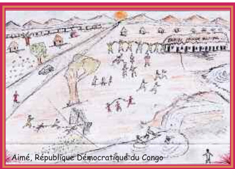
Aimé, République Démocratique du Congo

A toutes et à tous, nous souhaitons une très bonne année 2016 remplie de joie , de paix et d'espérance.