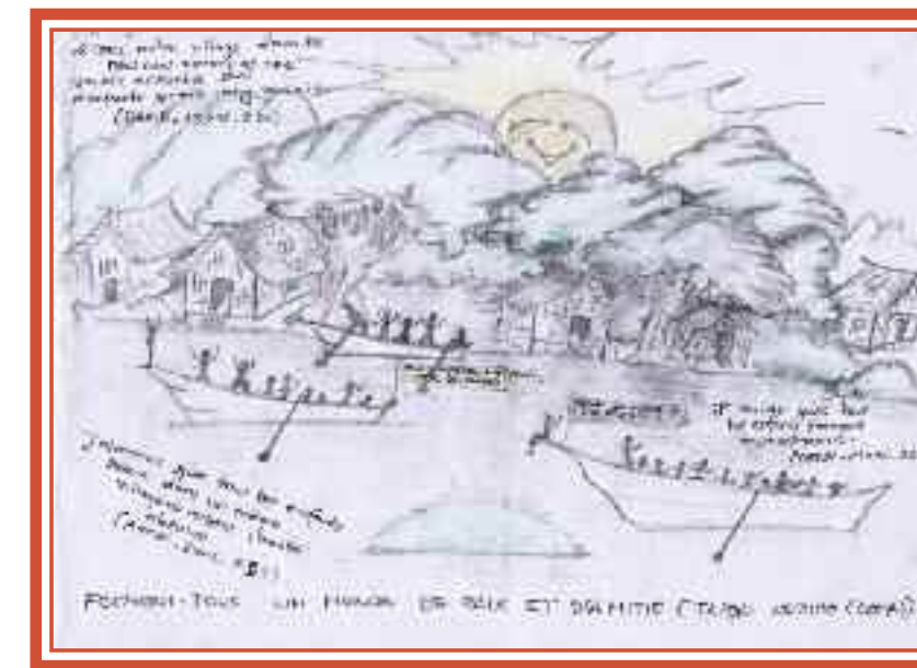
FORNISI-TOUS UN HOMME DE BIE ET D'AMITIE (TAPORI - Arcene Congo)