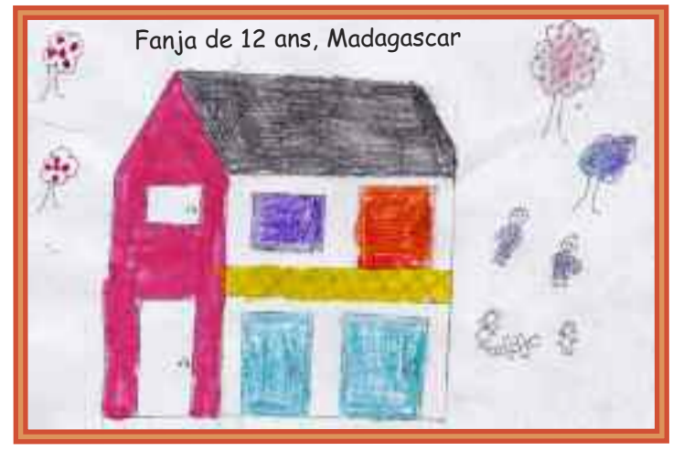
Fanja de 12 ans, Madagascar