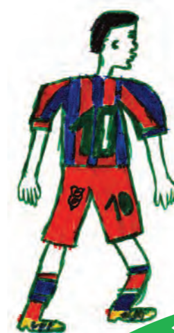
Djsmon 11 ans

Différents groupes Tapori de République Démocratique du Congo partagent leurs HISTOIRES VRAIES D'AMITIÉ Campagne TAPORI 2017: « Viens, cherchons ensemble les clés de l'amitié et de la paix. »