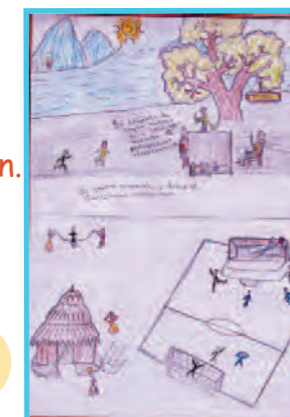
Hope, 13 ans

« Les enfants de Tapori sont autour d'une table sous un arbre, ils partagent leurs idées ensemble, ils jouent ensemble, dansent et chantent sans distinction. Ils terminent par puiser de l'eau à la rivière. »